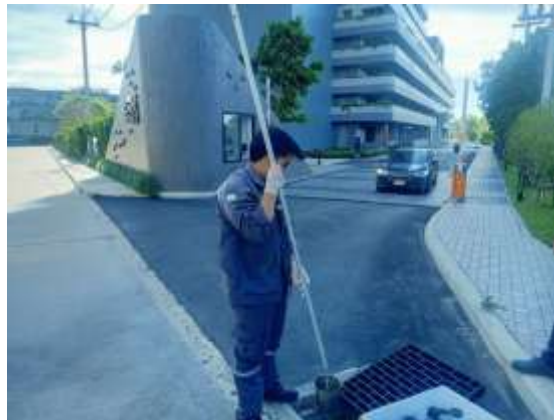
คุณภาพน้ำทิ้งก่อนระบายออกสู่ภายนอกโครงการหลังการบำบัด (บ่อตรวจคุณภาพน้ำพร้อมตะแกรงดักขยะ)

รูปที่ 3-1 จุดตรวจวัดคุณภาพน้ำโครงการ The Symphony (เดอะ ซิมโฟนี) บริษัท ทรีโอเนส อินดัสเทรียล จำกัด ระหว่างเดือนมกราคม – มิถุนายน พ.ศ.2566