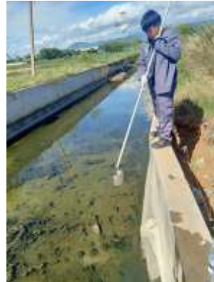
จุดที่ 2 บริเวณคลองน้ำเหม็น จุดระบายน้ำจากพื้นที่โครงการ เฟสที่ 6 (อาคาร F)