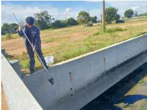
จุดที่ 1 บริเวณคลองน้ำเหม็น ก่อนจุดระบายน้ำจากพื้นที่ โครงการเฟสที่ 6 ระยะ 50 เมตร