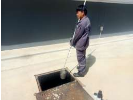
คุณภาพน้ำทิ้งก่อนบำบัด (บ่อเสถียร)