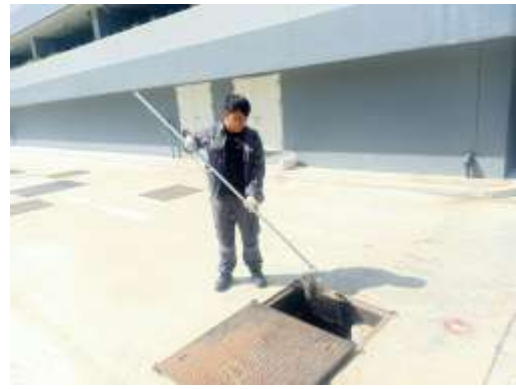
คุณภาพน้ำทิ้งหลังบำบัด (บ่อเก็บน้ำใส)