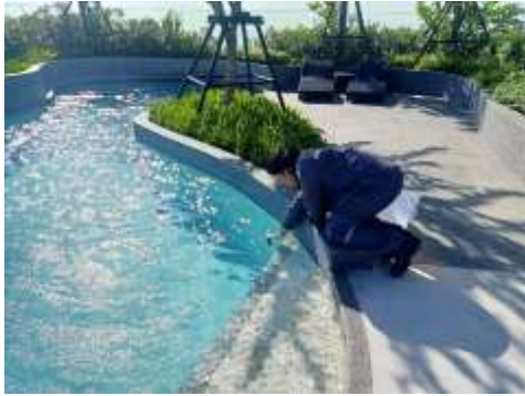
สระว่ายน้ำบริเวณส่วนลึก