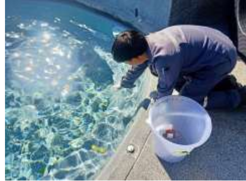
สระว่ายน้ำบริเวณส่วนตื้น

รูปที่ 3-1(ต่อ) จุดตรวจวัดคุณภาพน้ำโครงการ The Symphony (เดอะ ซิมโฟนี) บริษัท ทรีโอเนส อินดัสเทรียล จำกัด ระหว่างเดือนมกราคม – มิถุนายน พ.ศ.2566