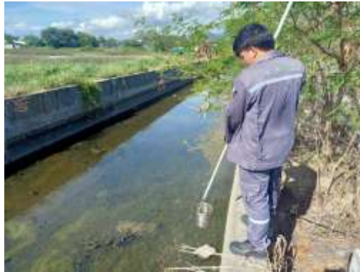
จุดที่ 3 บริเวณคลองน้ำเหม็น หลังพื้นที่โครงการเฟสที่ 6 (อาคาร F) ก่อนระบายออกสู่ทะเล

รูปที่ 3-1(ต่อ) จุดตรวจวัดคุณภาพน้ำโครงการ The Symphony (เดอะ ซิมโฟนี) บริษัท ตรีโอส อินดัสเทรียล จำกัด ระหว่างเดือนมกราคม – มิถุนายน พ.ศ.2566